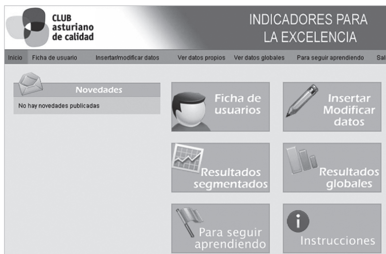
Pantalla del Sistema de Indicadores para la Excelencia.

La iniciativa parte de la experiencia de más de una década del club en la difusión de las ventajas del modelo, lo que ha impulsado su implantación en más de 50 organizaciones de distintos tamaños y sectores y ha situado al Principado en-