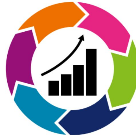
Mejora Continua con AOS